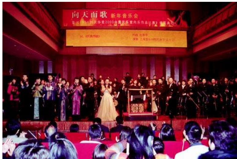
第一届比赛音乐会合影