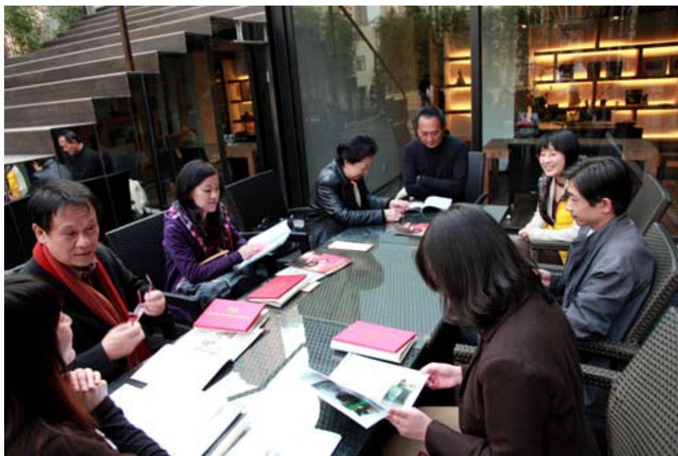
第四届比赛获奖者座谈会现场