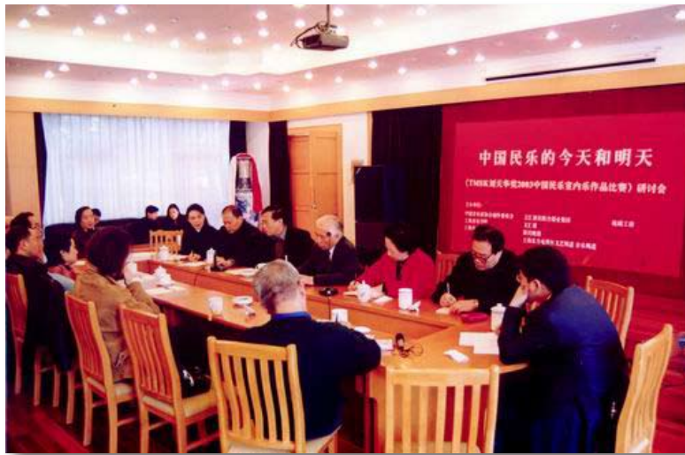
第一届比赛研讨会现场