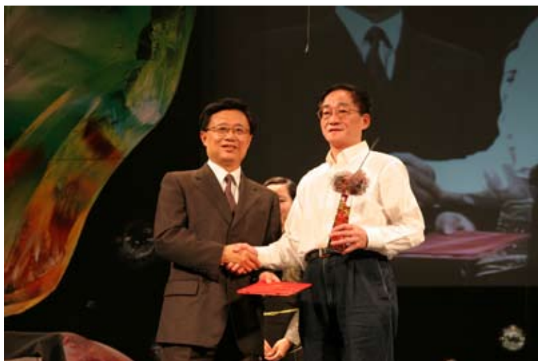
第二届比赛颁奖音乐会在上海兰心大戏院举行