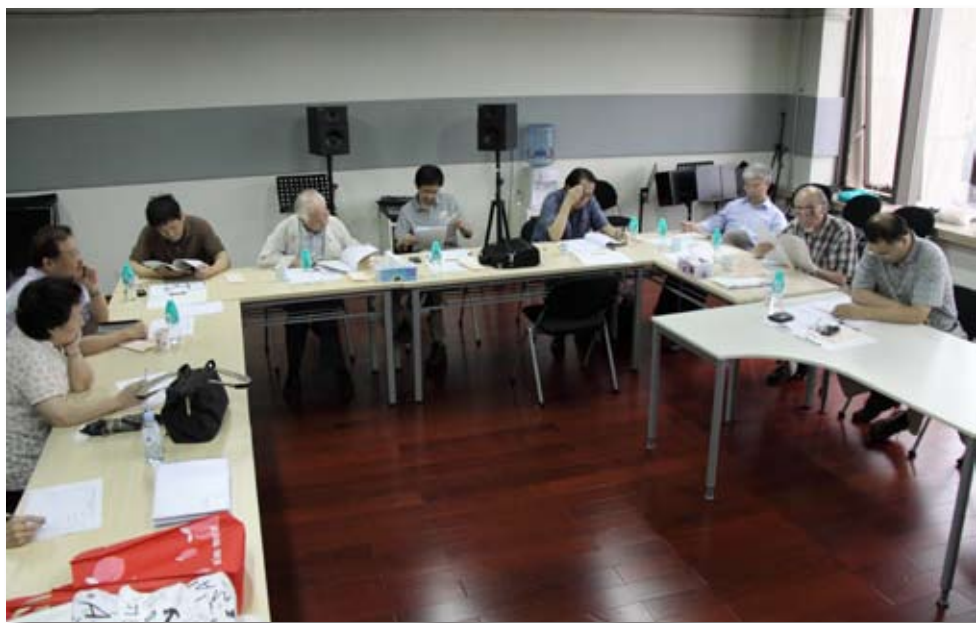
第四届比赛评审现场