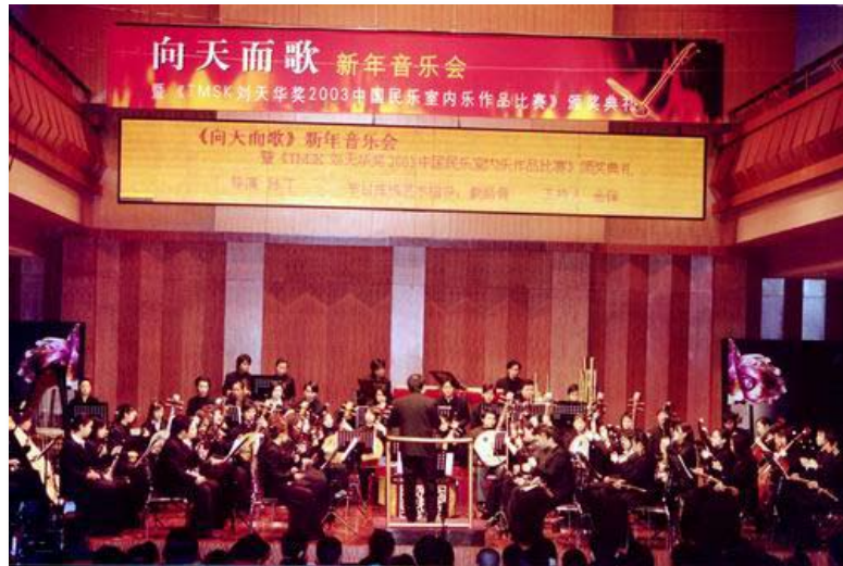
2003年12月，第一届民乐比赛颁奖音乐会在上海音乐学院贺绿汀音乐厅举行