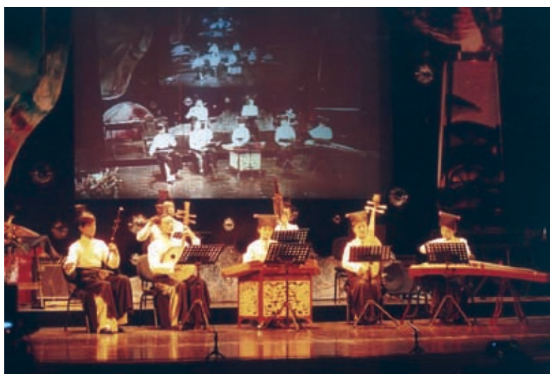
第二届比赛颁奖音乐会现场