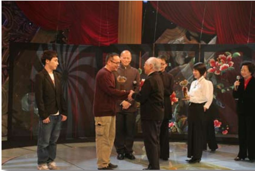
第三届比赛颁奖电视节目录制现场