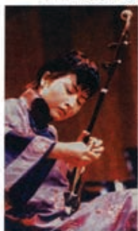
今晚一曲《光明行》

本报讯(记者杨建)一台以新年音乐会形式举行的颁奖礼,昨晚在上海贺绿汀音乐厅,让沪上听众领略了一批音乐新作的风貌。这批新作诞生于“TMSK刘天华2003中国民乐室内乐作品比赛”为期一年的征集和评选。市领导、王仲伟、宋晓明等出席了音乐会。