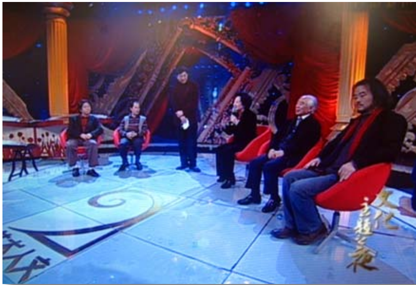
第三届比赛上海东方电视台“艺术人文频道”研讨会现场