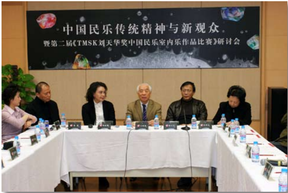
第二届比赛研讨会现场