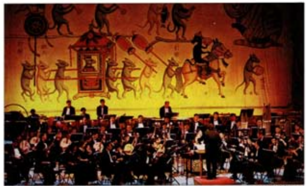
中国民乐的发展需要表演的舞台和对传统的尊重

一个民族的文化要生存下去，它就必须发展，必须在全世界有“活动”。扎好民族音乐的根，在新路上延续历史。我们是历史的一环，就要成为衔接其中的一分子，不能让它在我们手中断掉。虽然一个奔跑着的人是很难思考问题的，但对于民乐让我们且行且思。