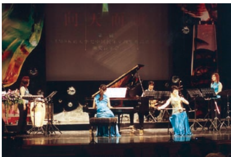
第二届比赛颁奖音乐会现场