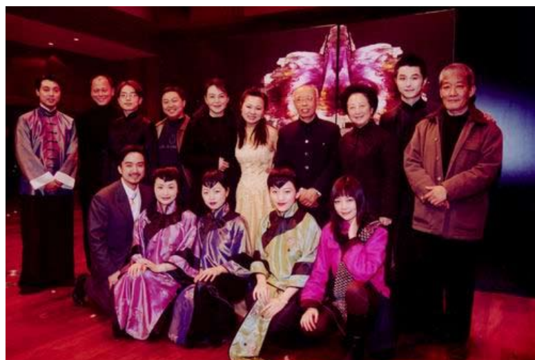
第一届比赛音乐会合影