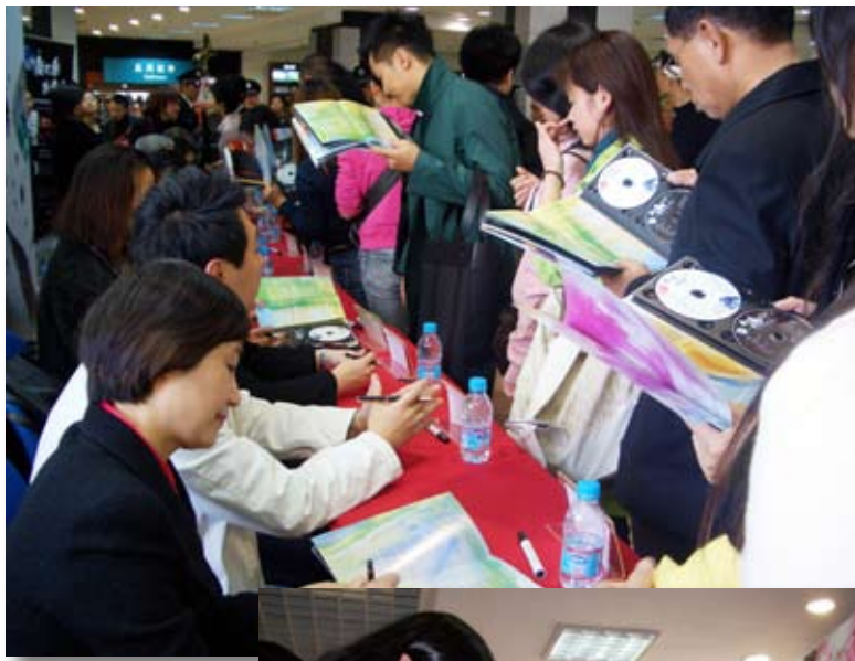
第二届民乐比赛 获奖作品CD签售 仪式现场